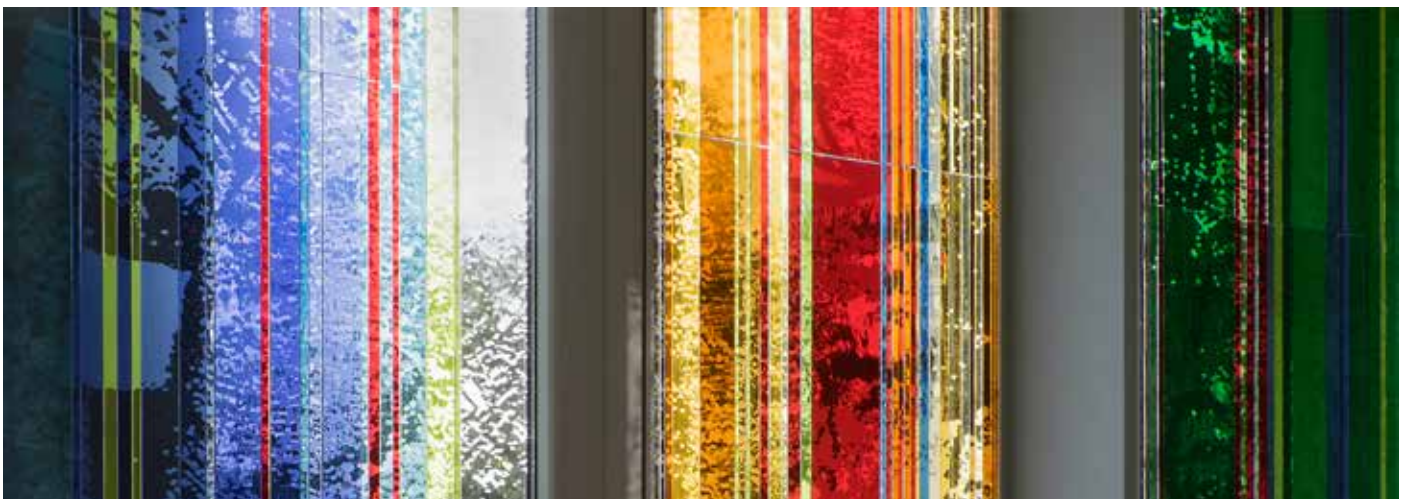
Amalie Sieveking Krankenhaus - Detail